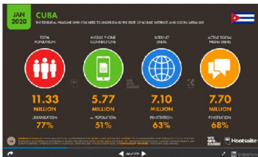
Figura 3. Datos estadísticos en Cuba (enero 2020)

Los meses que ya llevamos de enfrentamiento frontal a la Covid-19, y el inicio del proceso de recuperación en Cuba, ha significado un reto para los medios de comunicación.